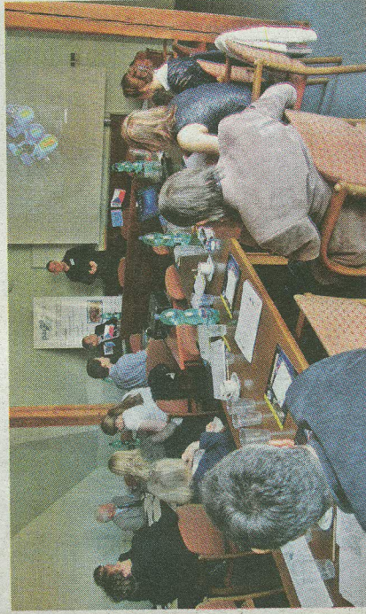
Kulatý stůl se zástupci firem z oboru informatiky (26. 4. 2012).

Více informací o plánovaných akcích projektu PARNET naleznete na webu: http://parnet.ujep.cz