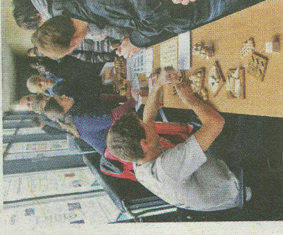
Den PŘF UJEP 8. 11. 2012 (oslava 7. výročí založení fakulty).