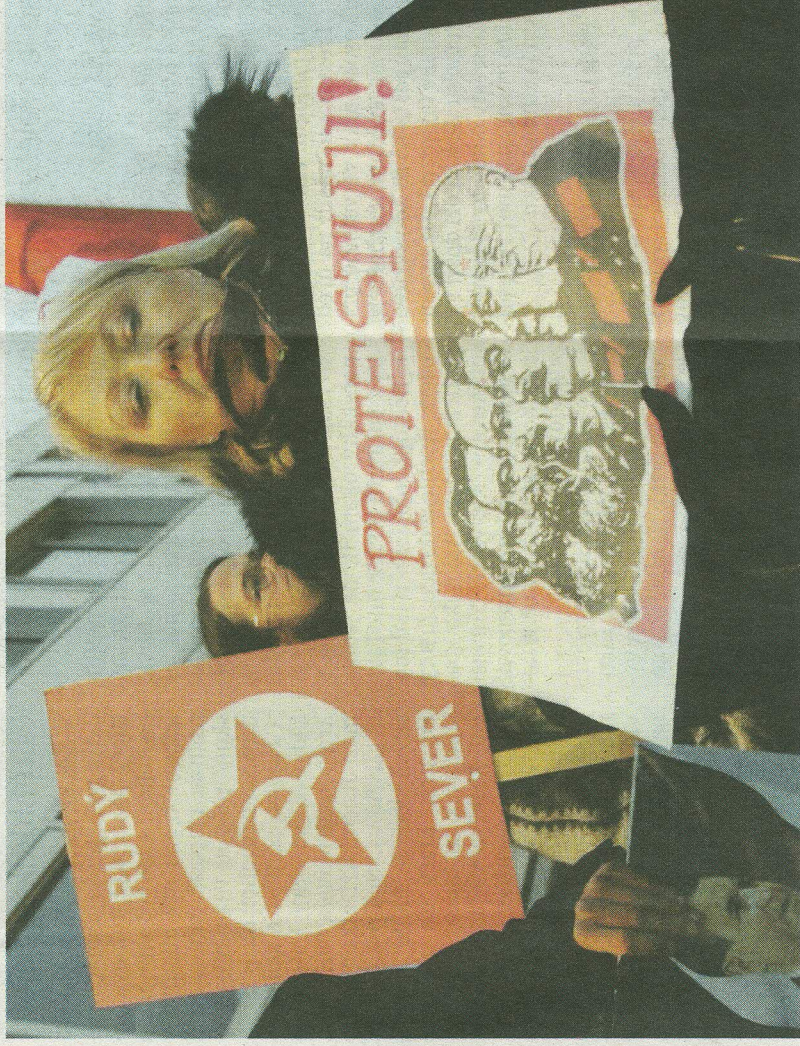
RUDÝ HAPPENING. Zpěv internacionály, projekce obrázků na „vanu“ a opět vyvěšené komunistické heslo na její stěně. To byl páteční večerní protikomunistický happening. Fotogalerii z akce najdete na webu usteckydenik.cz

„Toto je happening. My ne- chceme svrhnout z oken krajské radnice pana Bubeníčka, konekonce v tomto počtu bychom to pravděpodobně ani nedokázali,“ pokračuje řeč- ník. „Ale na druhou stranu chceme říci, že to, co setady na severu Čech stalo, je mini- málně neestetické. Je to ne- hezké, odporné a je to slizké.“ Od středy má Ústecký kraj